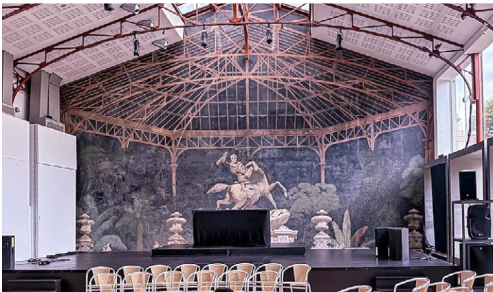
Jardim de Inverno, del Teatro M. São Luiz, Lisboa