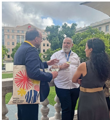
Encuentro informal posterior entre representantes de La Red Española de Teatros, A Rede de Teatro e Cineteatros Portugueses, DgArtes e INAEM.