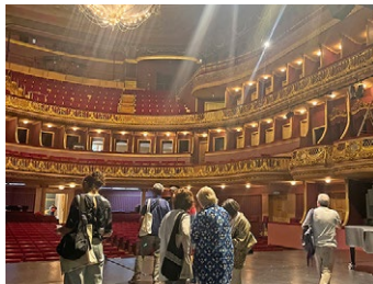
Vista desde escenario de la Sala Luís Miguel Cintra.