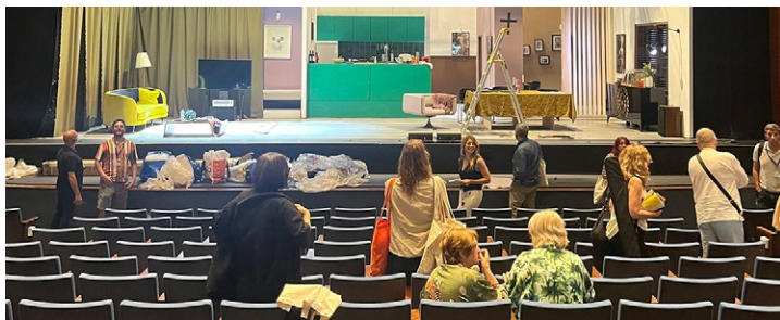
Auditorio del TAGV, Teatro Académico Gil Vicente

La entrada a este espectáculo tiene un coste de 7€ a abonar en taquilla