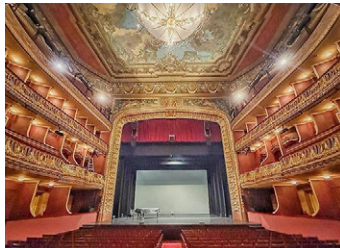
Sala Luís Miguel Cintra, Teatro M. São Luiz, Lisboa