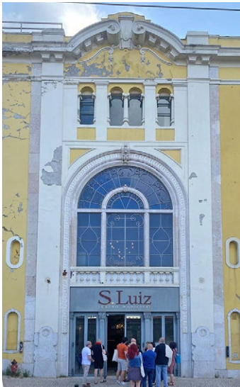
Teatro Municipal São Luiz, Lisboa