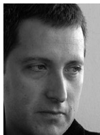
Jose Luis Rivero Auditorio de Tenerife