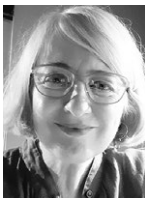
Grego Navarro Teatro Gayarre Pamplona

La Comisión Internacional ha sido el espacio de impulso, debate y planificación de todas las acciones de este ámbito. Durante 2025 se ha reforzado su papel como grupo de trabajo estratégico, implicando tanto a espacios con experiencia previa en la cooperación internacional como a aquellos que comienzan a desarrollarla.