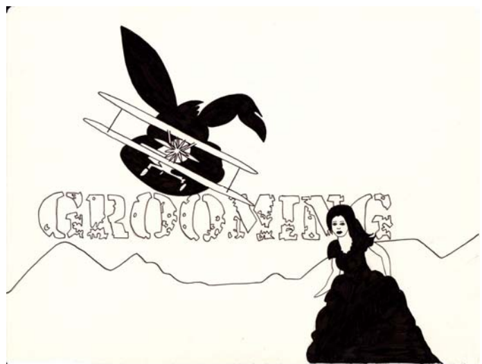
Ilustraciones de ©Paco Bezerra. 2011.