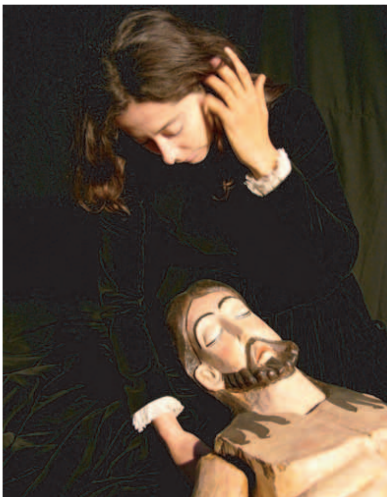
Misterio del Cristo de los Gascones