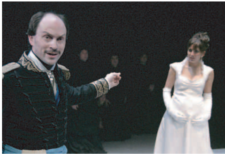
Cuento de invierno