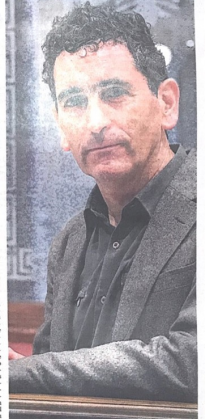
El dramaturgo Juan Mayorga (Madrid, 1960)...