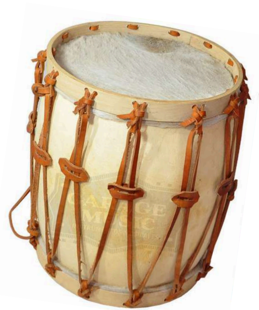
Bombo legüero, instrumento de percusión típico del folklore argentino, utilizado en FARRA