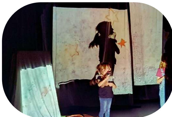
Taller sombra corporal –Teatro « Le Chaudron » – Montignac (Fr) – 2022

Cada situación siendo única, el programa se elabora cuidadosamente en concertación con los organizadores, para responder al máximo a las necesidades y expectativas de los participantes.