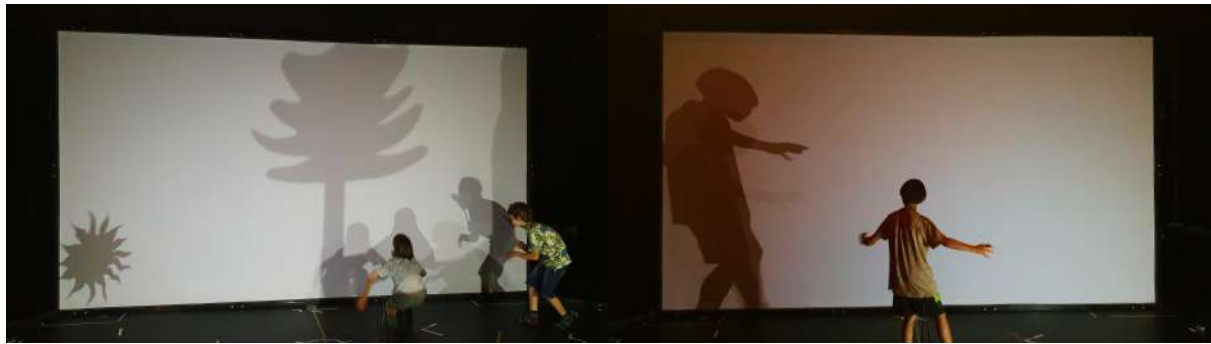
Taller sombra corporal - Centro de arte contemporáneo de la ciudad de Murcia - (Es) - 2024