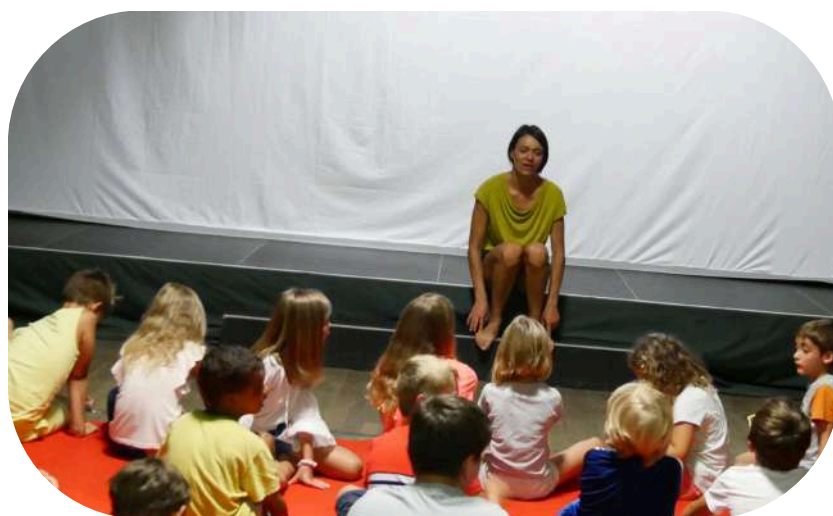
Taller sombra corporal – Ciudad de Proissans - (Fr) – 2021

Una experiencia de creación completa, desde la exploración hasta la escena, adaptable a cualquier público y contexto — centro escolar, asociación cultural, centro cívico o festival.