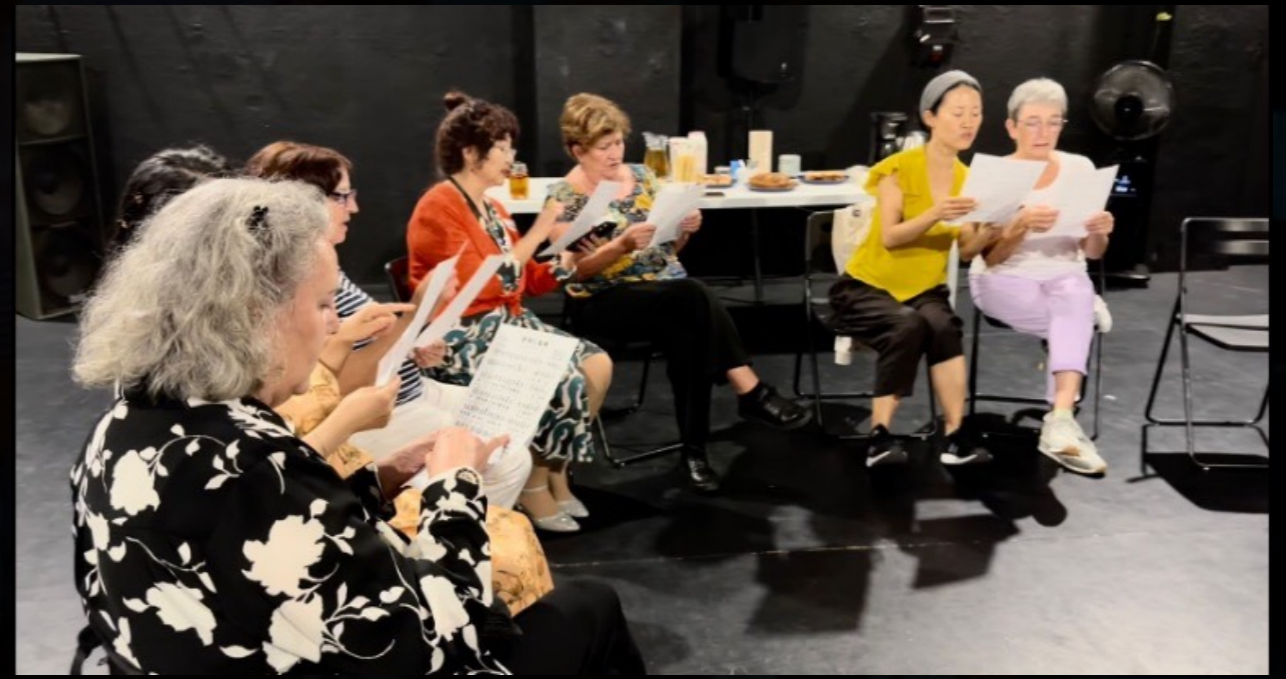
Fotos de la actividad de mediación con abuelas de la comunidad china en Madrid y abuelas españolas.