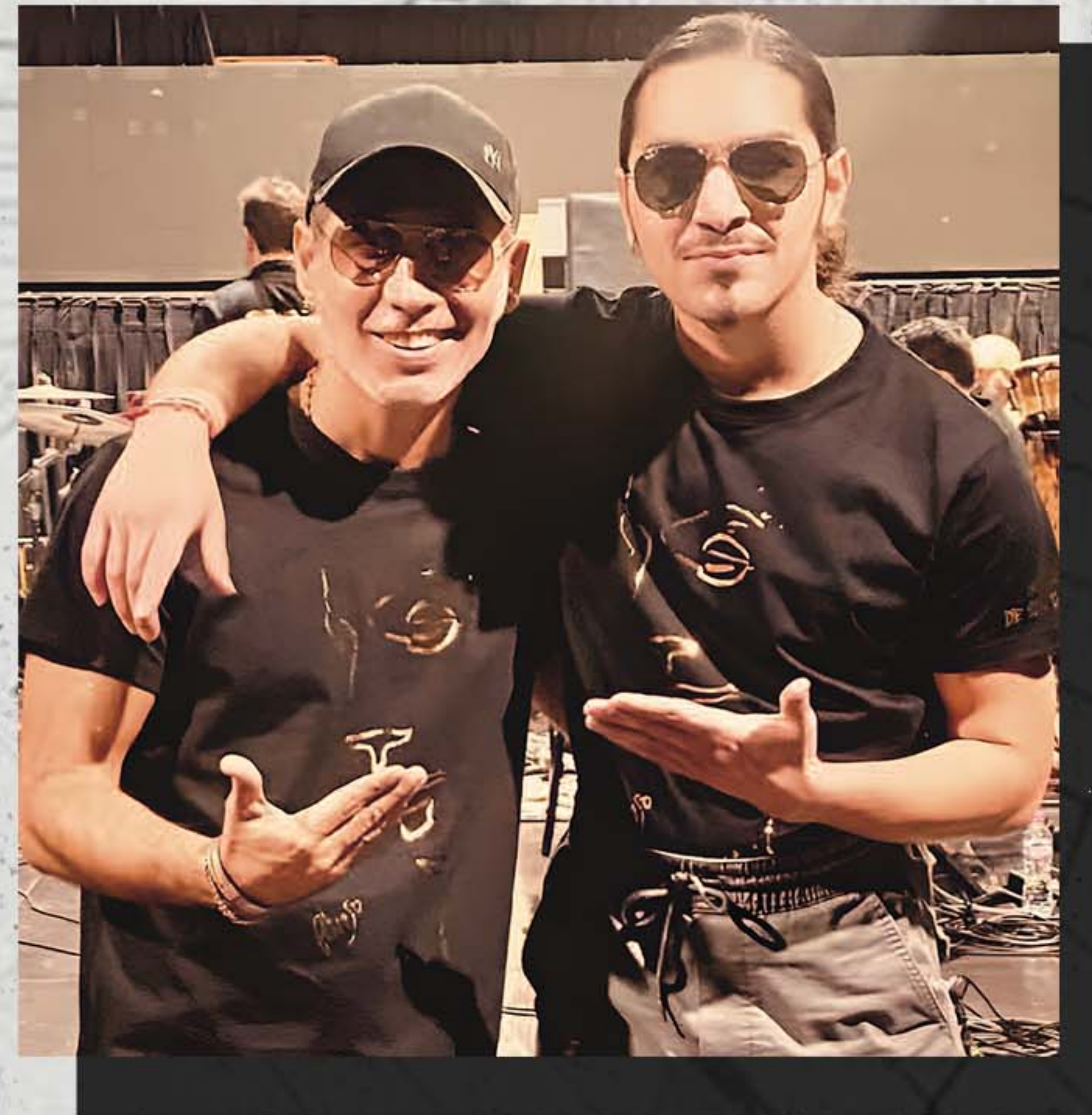
PITINGO Colaboración último disco y gira