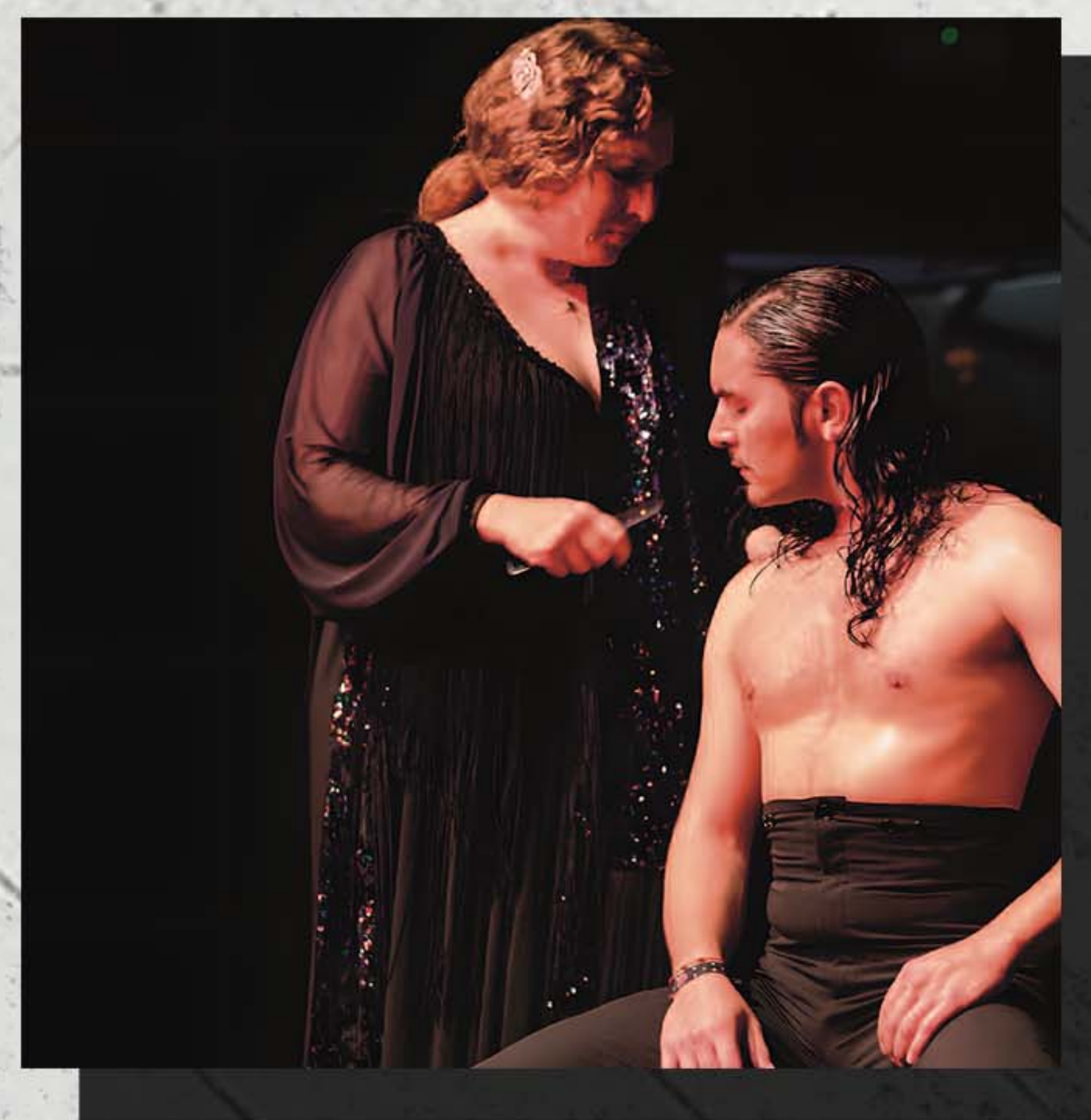
ESTRELLA MORENTE Colaboración