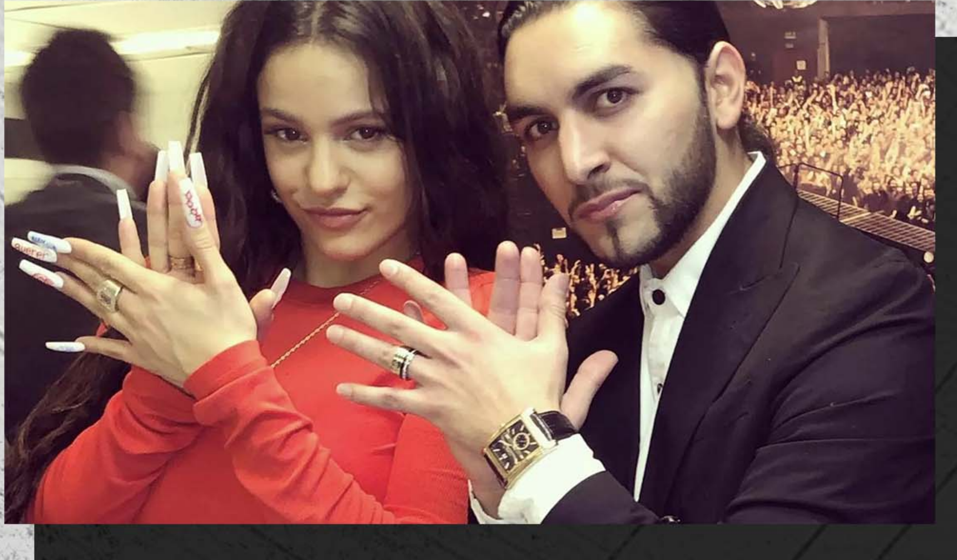
ROSALÍA Gira de “El Mal querer Tour”