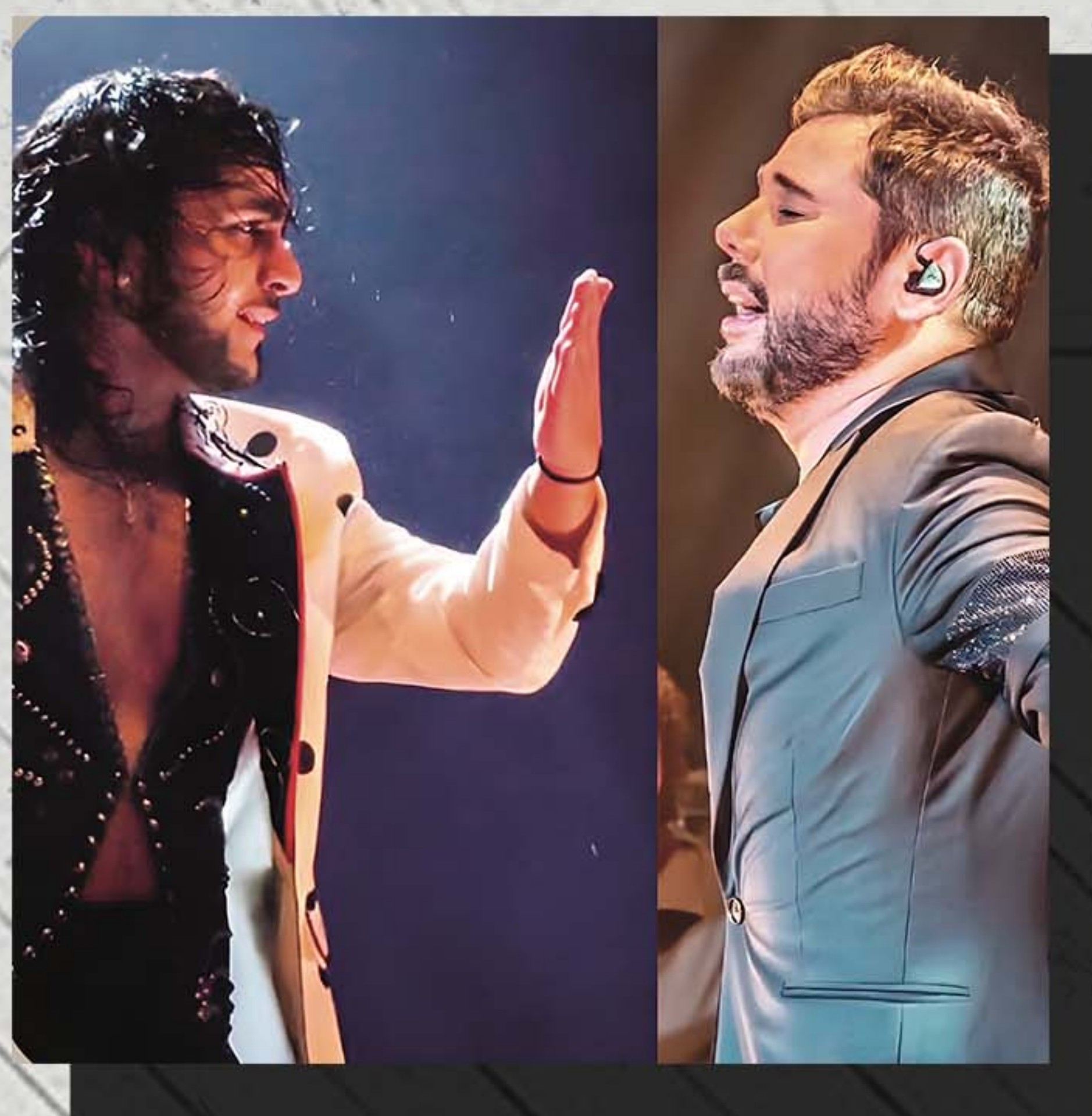
MIGUEL POVEDA Gira Miguel Poveda