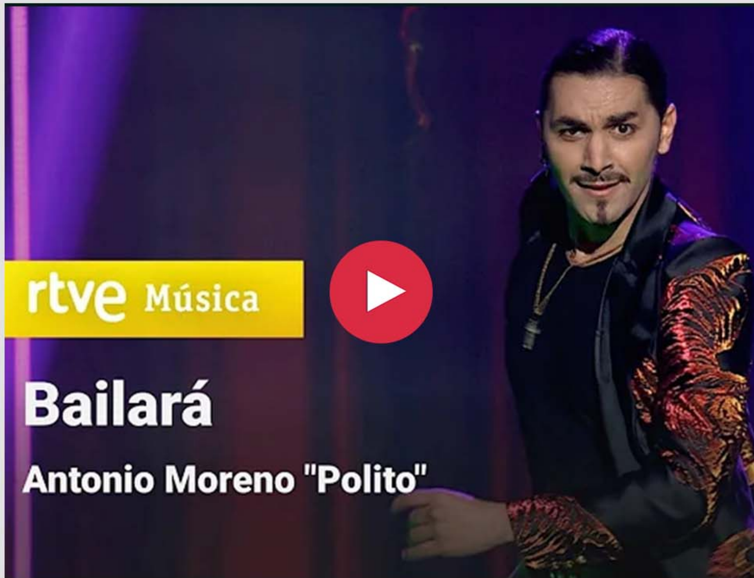
Gala de Fin de Año 2023 - RTVE