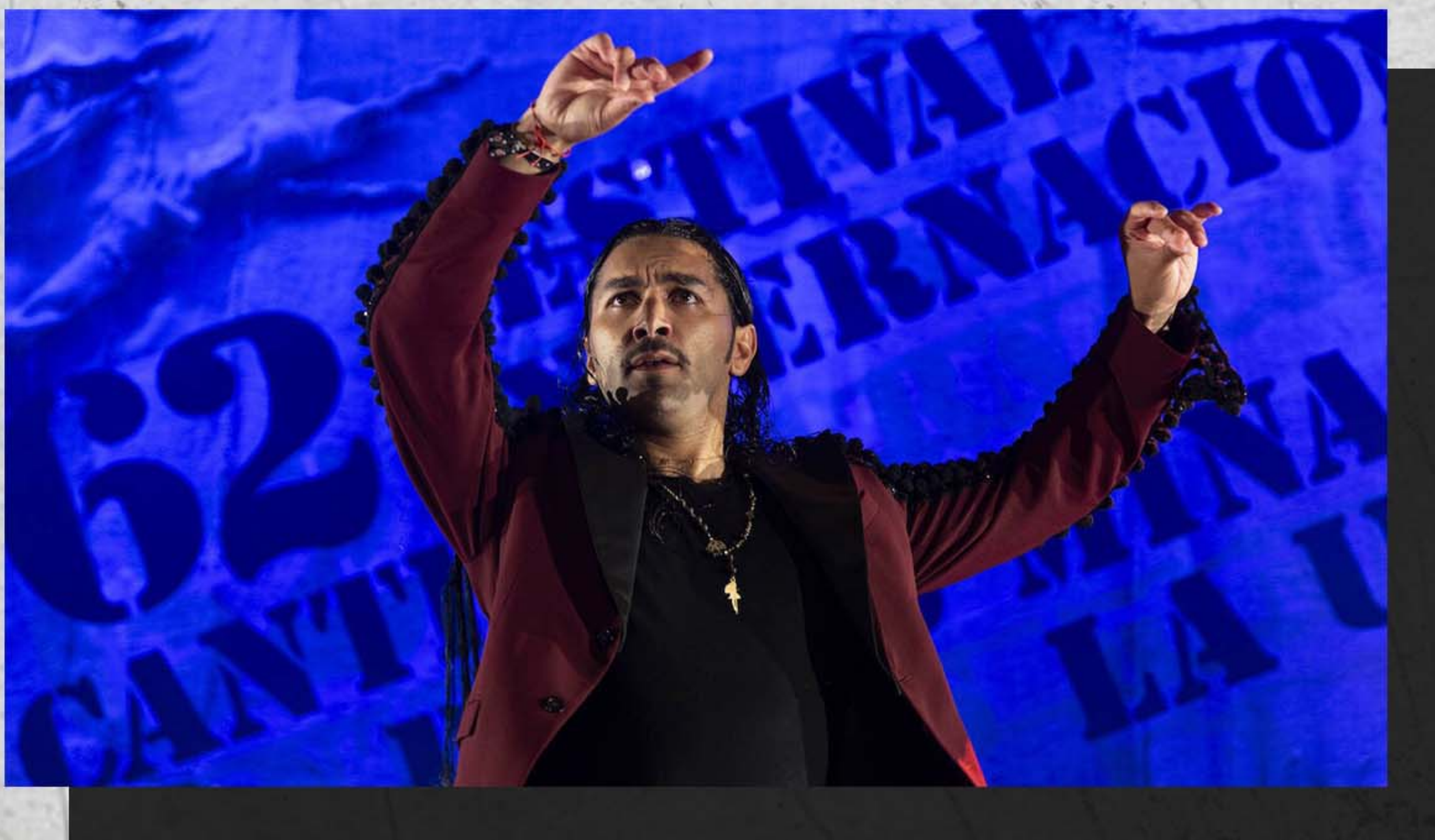
Festival del Cante de las Minas 2023