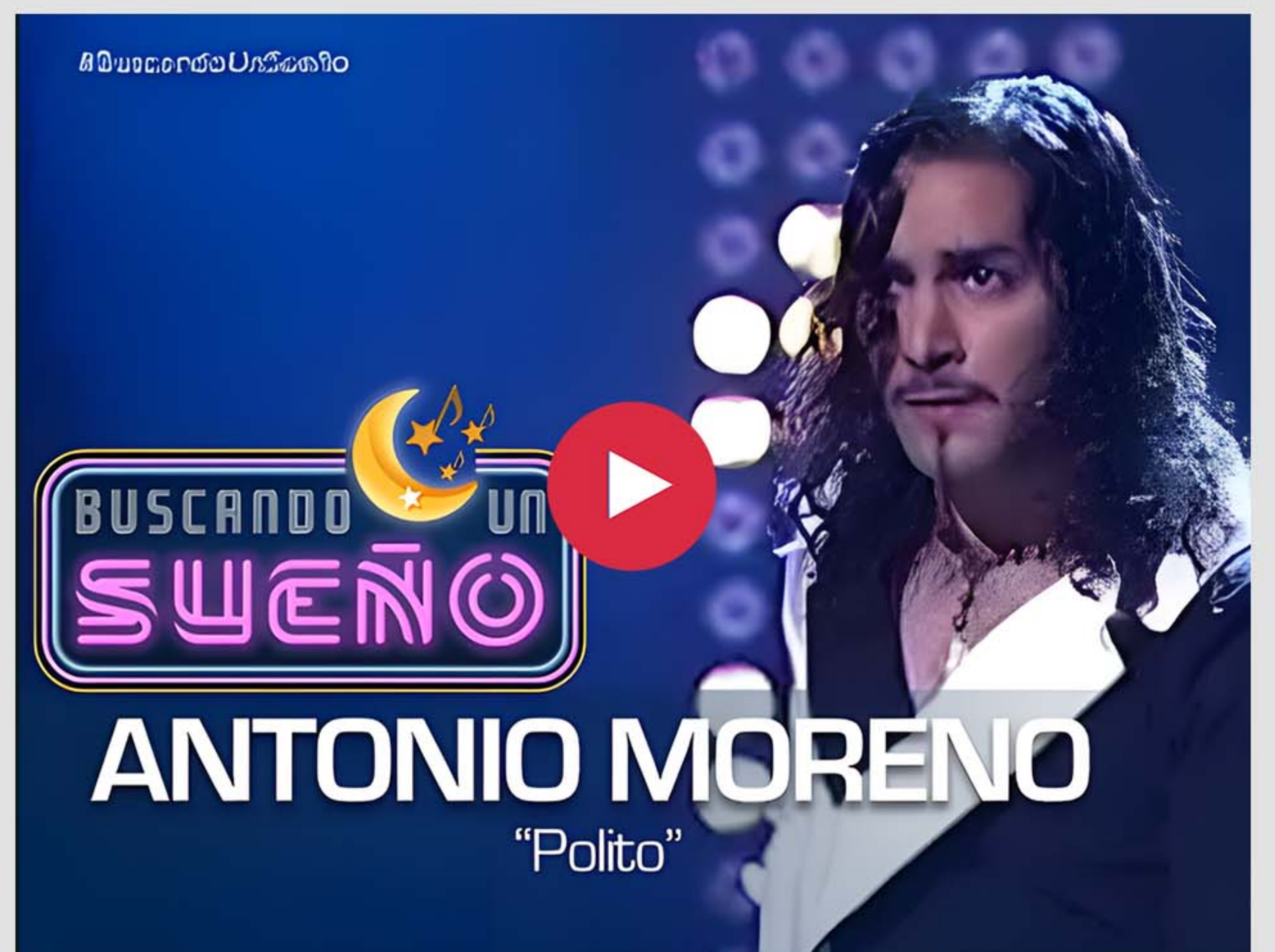
Castilla la Mancha TV