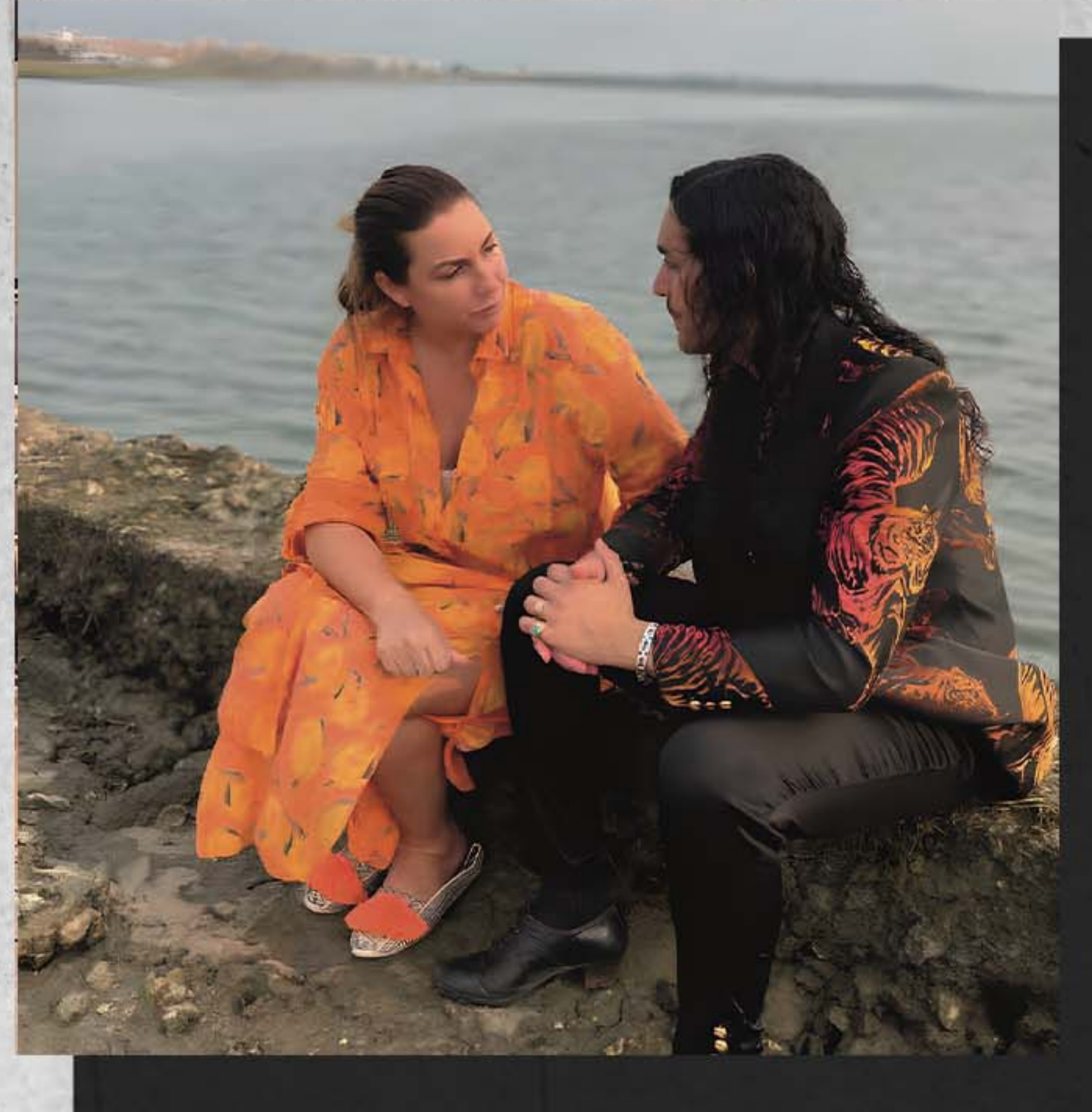
NIÑA PASTORI Colaboración en Gira