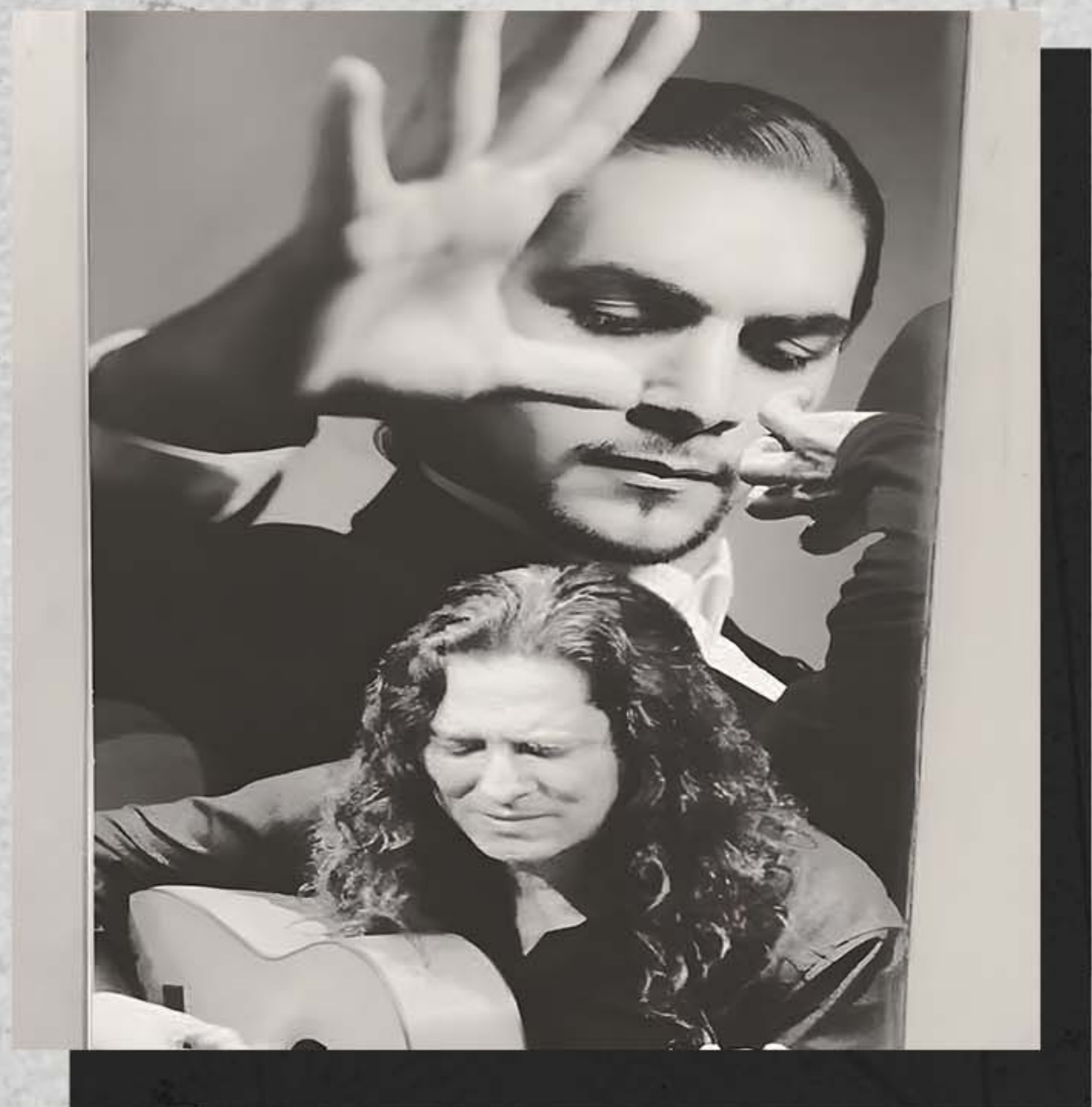
TOMATITO Colaboración en Gira