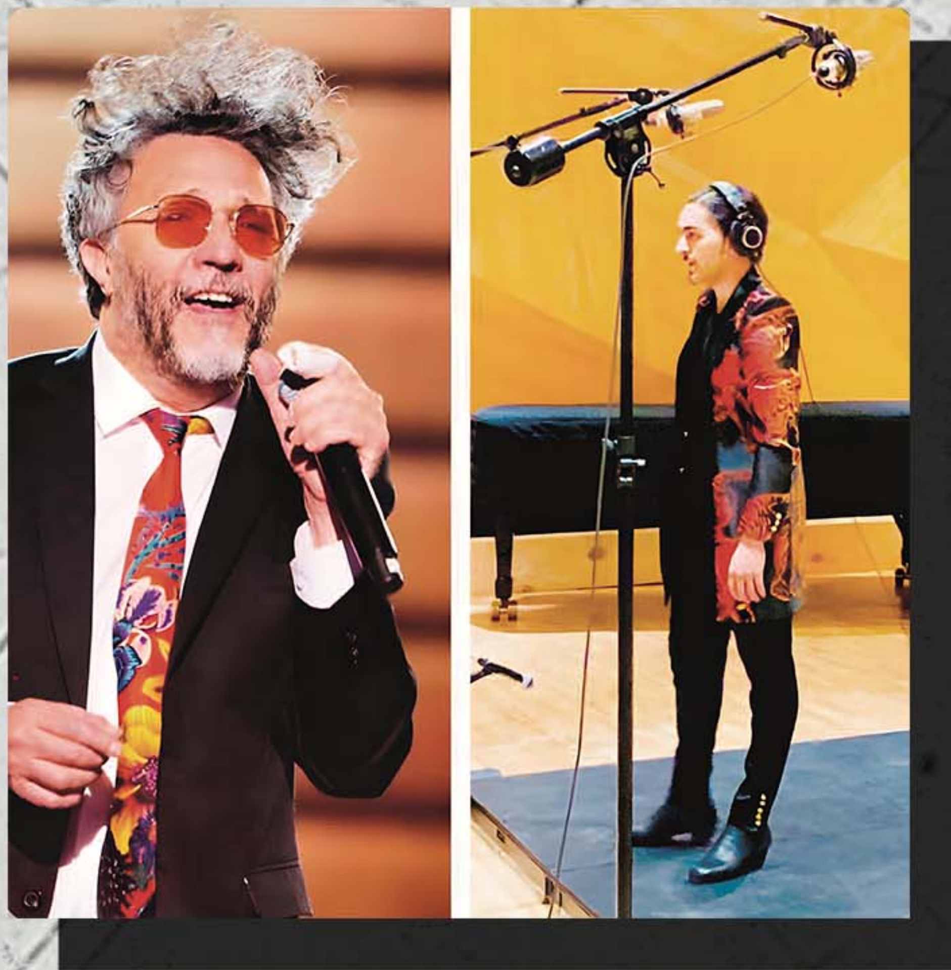
FITO PÁEZ Colaboración en el último disco